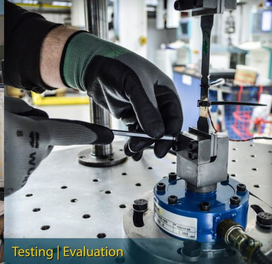
Testing | Evaluation

Wann kommst DU in unser Team? Gemeinsam machen wir die Welt sicherer!